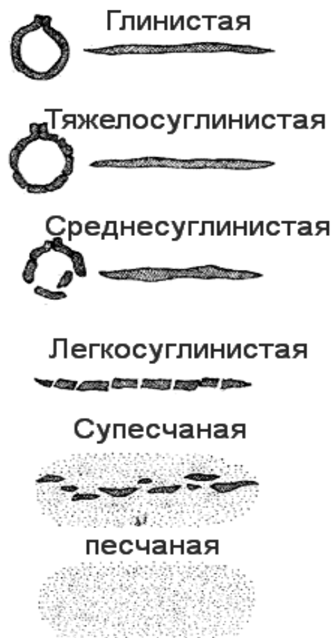
Рис. 1. Виды почв

Для первой группы характерно строгое нормирование расстояний между растениями в двух взаимно перпендикулярных направлениях, что допускает движение машин по занятому культурой полю в двух направлениях и позволяет практически постоянно механизировать обработку почвы во время роста растений.